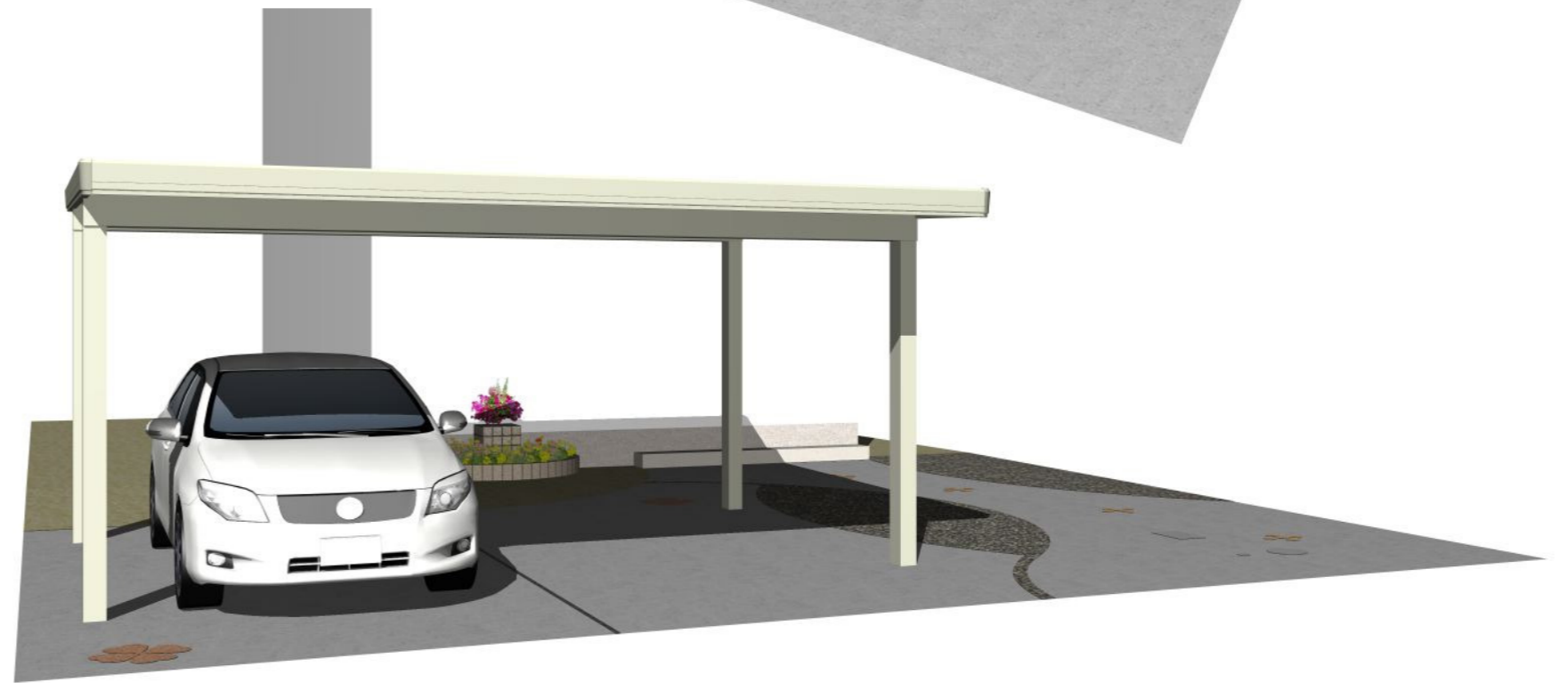
外構工事完成予想図